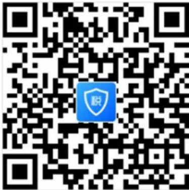
IOS 系统手机专用 APP 下载